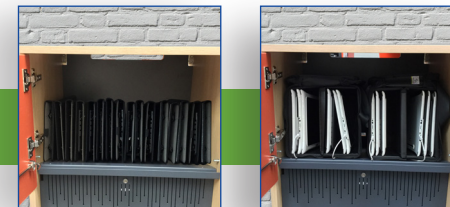
2 possibilités d'accueil des tablettes : cloisons de séparation ou paniers de transport !

Dimensions LxPxH (mm.) : 580 x 560 x 1.200. Poids : 45 Kg